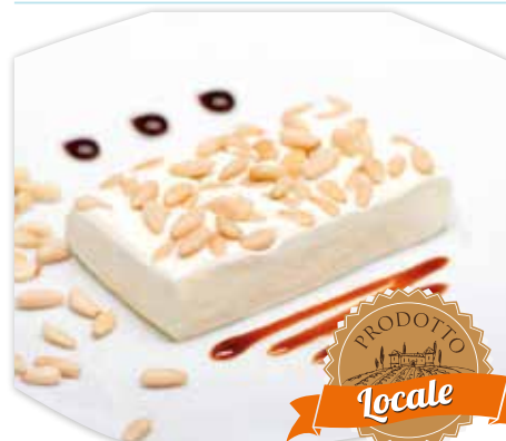
18689 MATTONELLA DESSERT AI PINOLI ARTE DEL GELATO 20 pezzi x 60 g