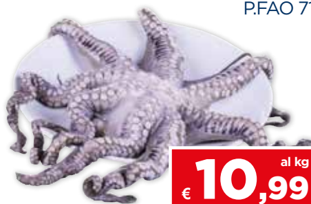
51401 POLPO LAVORATO DEC. P.FAO 71