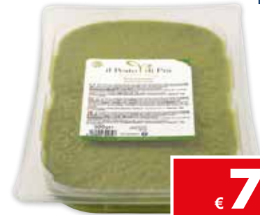
77211 PESTO GENOVESE DI PRÀ 500 g