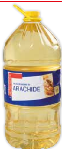
20481 OLIO DI SEMI DI ARACHIDE +PERFORMANCE 10 L