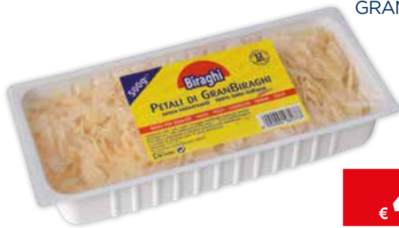
46285 PETALI FORMAGGIO GRAN BIRAGHI 500 g