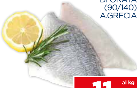
51201 FILETTI DI ORATA (90/140) A.GRECIA