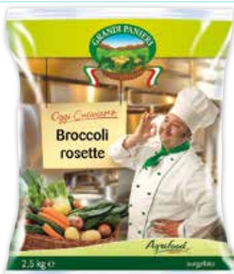
76903 BROCCOLI ROSETTE GRANDI PANIERI 2,5 kg