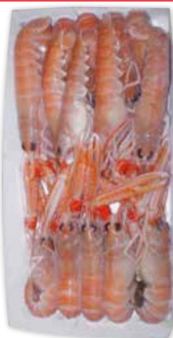
* 6450 SCAMPI (8/12) SCOZIA 750 g