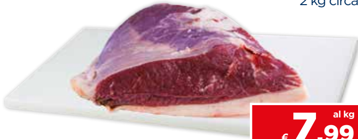
29537 PICANHA SCOTTONA sottovuoto 2 kg circa