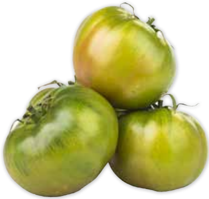
17958 POMODORI INSALATARI CAT.I ITALIA