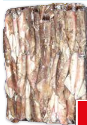
23098 CALAMARO C/4 L (13/15 cm) ATLANTICO