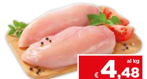
33183 PETTO DI POLLO 1,5 kg circa