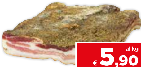
77207 PANCETTA TESA AL PEPE ZAMPINI a metà sottovuoto 1,5 kg circa