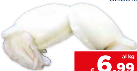
42714 SEPPIE (U/1) (1000/2000) INDIA GL.30%