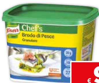
21736 BRODO GRANULARE DI PESCE KNORR 550 g