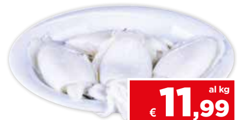
50666 SEPPIE (PULITE) P.FAO 27