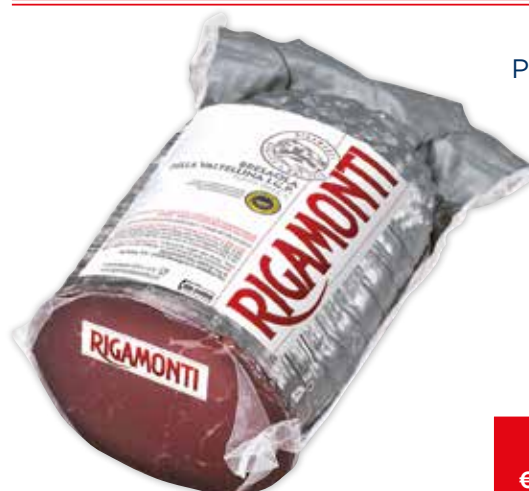
20103 BRESAOLA PUNTA D'ANCA I.G.P. RIGAMONTI a metà