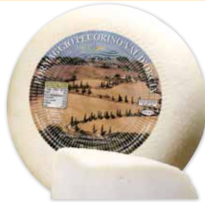
96 PECORINO PIENZA FRESCO VAL D'ORCIA 1,2 kg circa