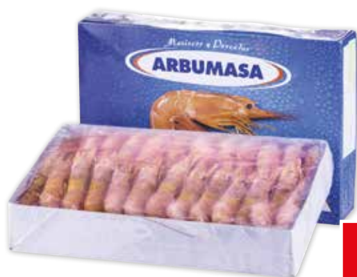
* 51498 GAMBERI L2 ARGENTINA (ARBUMASA) CONGELATI A BORDO GL.0% 2 kg