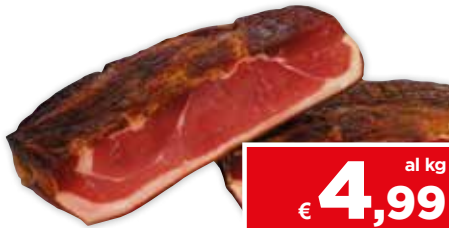
77206 SPECK STAGIONATO ZAMPINI a metà sottovuoto 1,5 kg circa