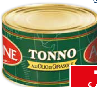
45614 TONNO ALL'OLIO DI GIRASOLE AIRONE 1,730 kg