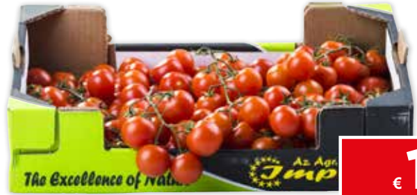
17977 POMODORO CILIEGINO CAT.I ITALIA