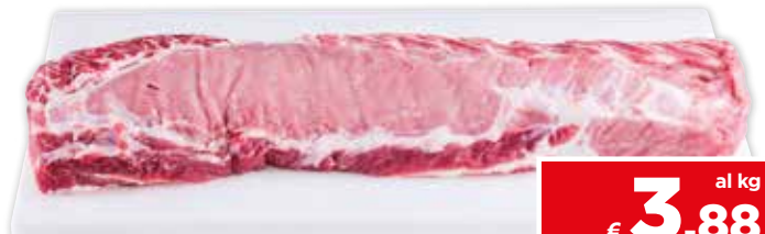
33843 FILONE SUINO ESTERO sottovuoto 4,5 kg circa