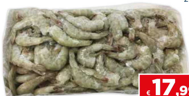
26285 MAZZANCOLLE CODE (41/50) ECUADOR GL.0% 2 kg