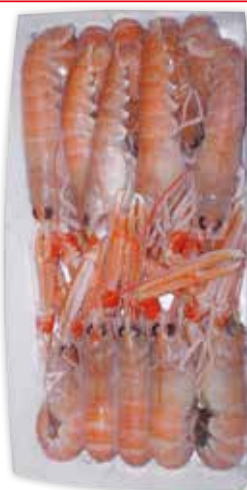
6450 SCAMPI (8/12) SCOZIA 750 g