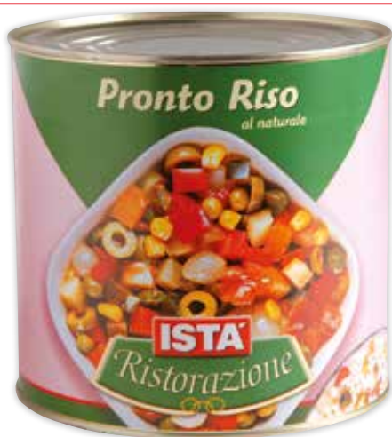
26408 PRONTO RISO ISTÀ AL NATURALE 2,6/1,6 kg