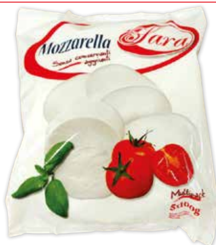
76255 MOZZARELLA SARA TREVISANALAT 5 x 100 g