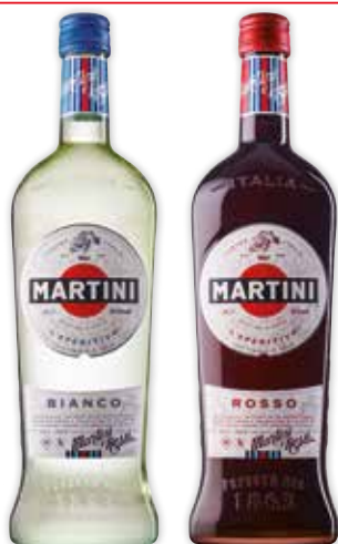
5552/5553 MARTINI BIANCO/ ROSSO 1L