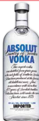
27079 VODKA ABSOLUT 1L