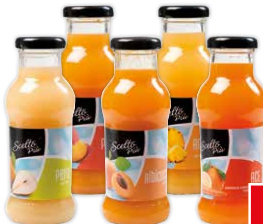
21169/21171/21172/21180/21185 SCELTO PIÙ PERA/ PESCA/ ALBICOCCA/ ANANAS/ ACE 200 ml