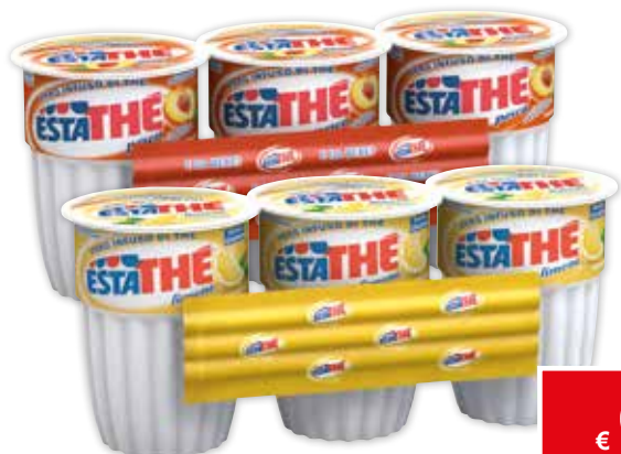
5147/5149 ESTATHE PESCA/ LIMONE 3 x 20 cl